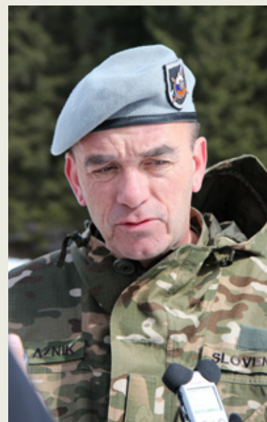
Polkovnik Boštjan Blaznik

Rojen je bil leta 1965, šolal se je na Gimnaziji Kranj in študiral na Fakulteti za družbene vede v Ljubljani, kjer je diplomiral leta 1990.